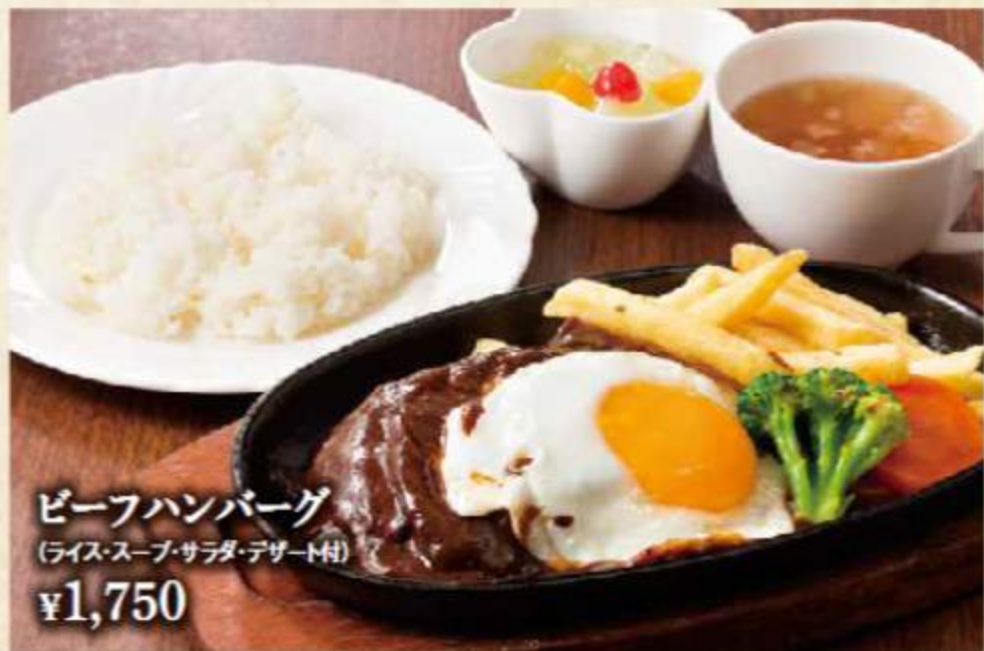
ビーフハンバーグ (ライス・スープ・サラダ・デザート付) ¥1,750