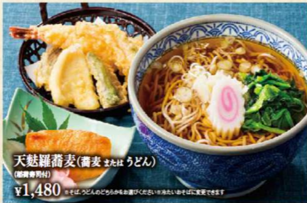
天麩羅蕎麦(蕎麦 または うどん)