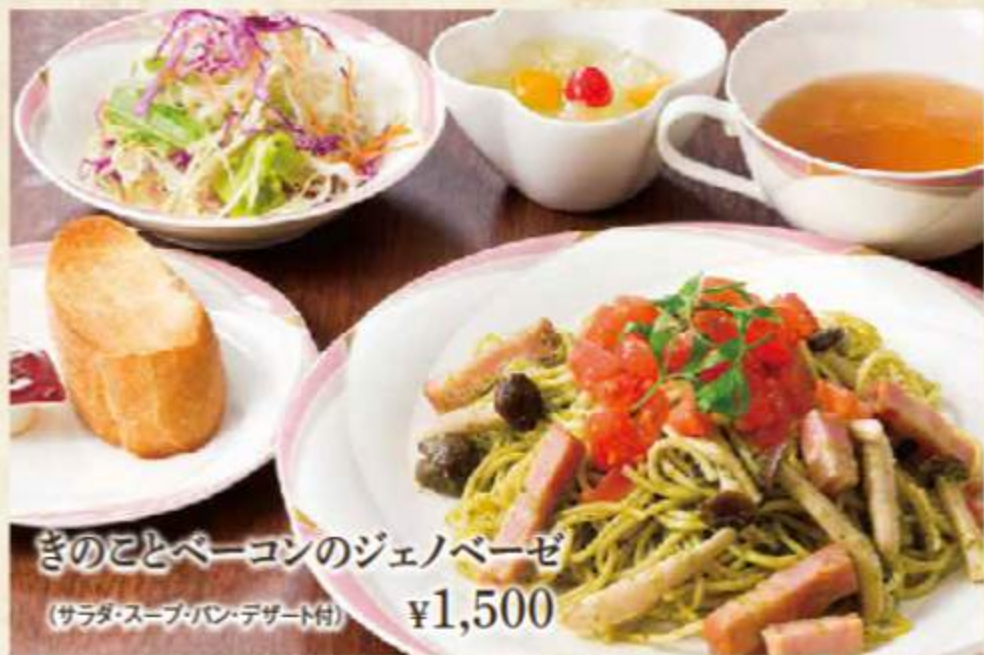
きのことベーコンのジェノベーゼ (サラダ・スープ・パン・デザート付) ¥1,500