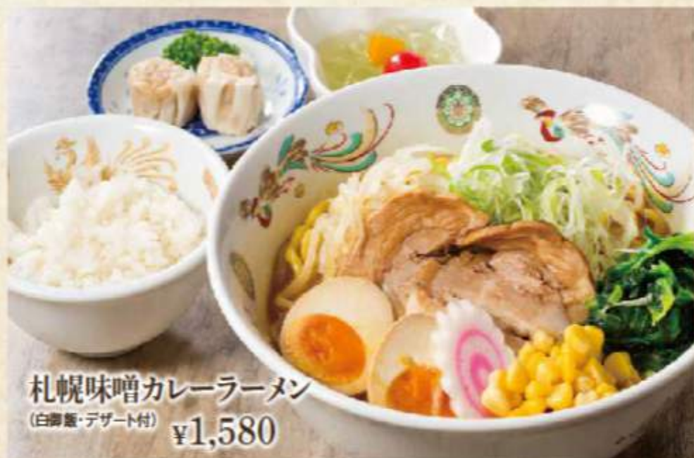
札幌味噌カレーラーメン (白御飯・デザート付) ¥1,580