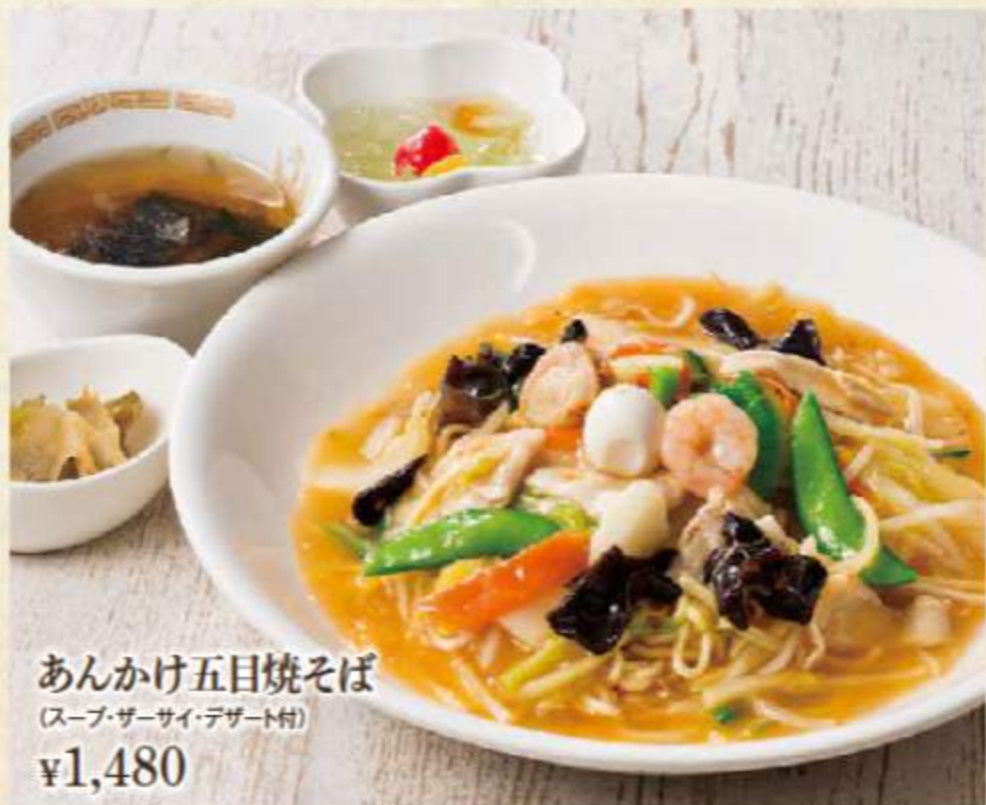
あんかけ五目焼そば (スープ・サーサイ・デザート付) ¥1,480