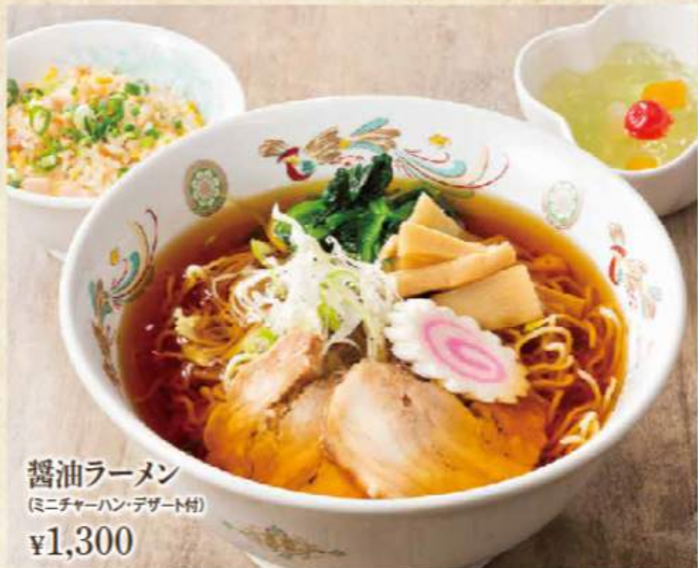
醤油ラーメン (ミニチャーハン・デザート付) ¥1,300