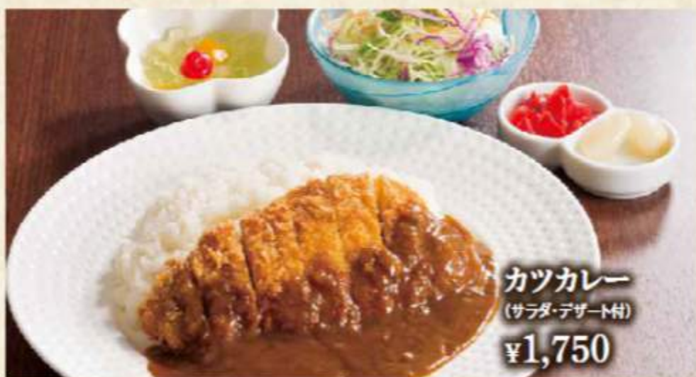
カツカレー (サラダ・デザート付) ¥1,750