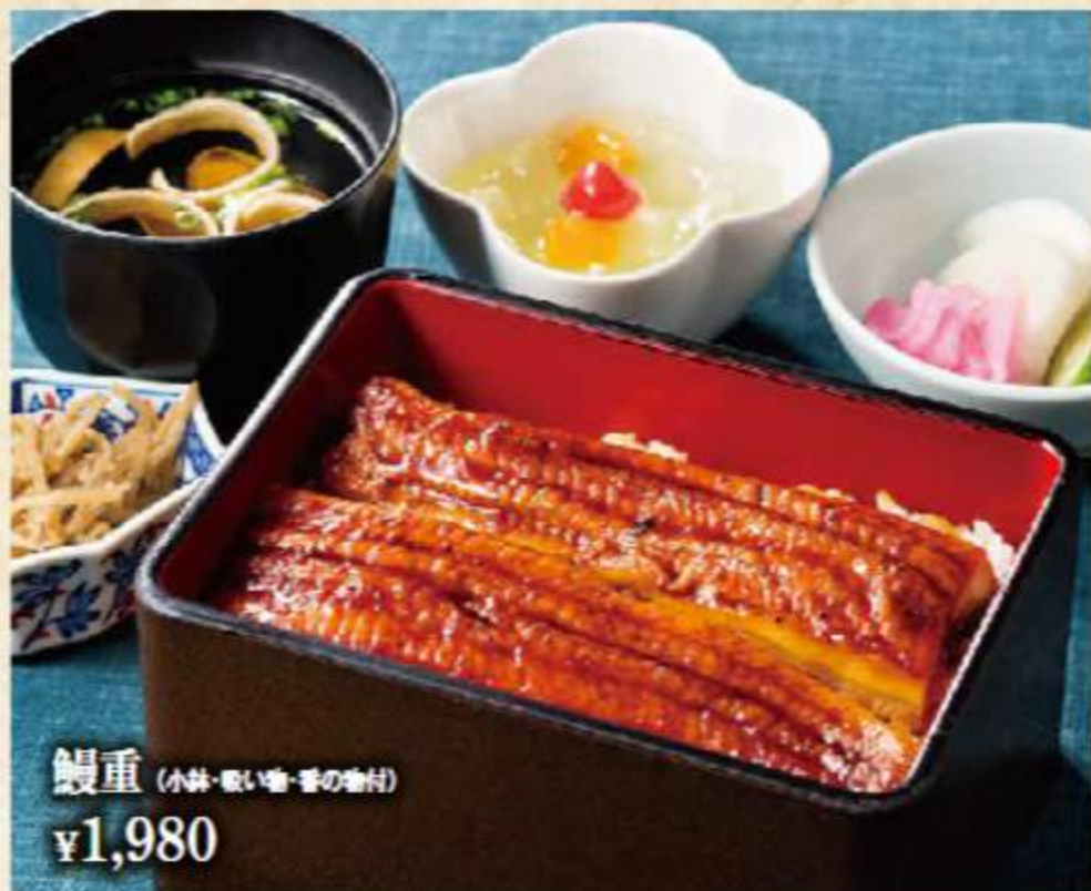
鰻重 (小鉢・吸い物・香の物付) ¥1,980