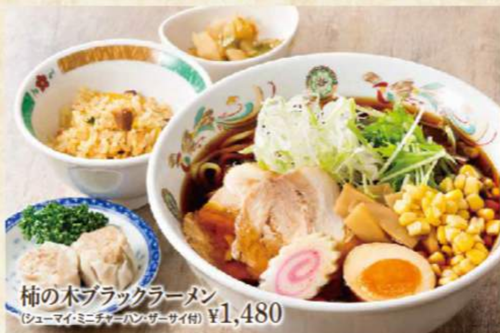
柿の木ブラックラーメン (シューマイ・ミニチャーハン・ザーサイ付) ¥1,480