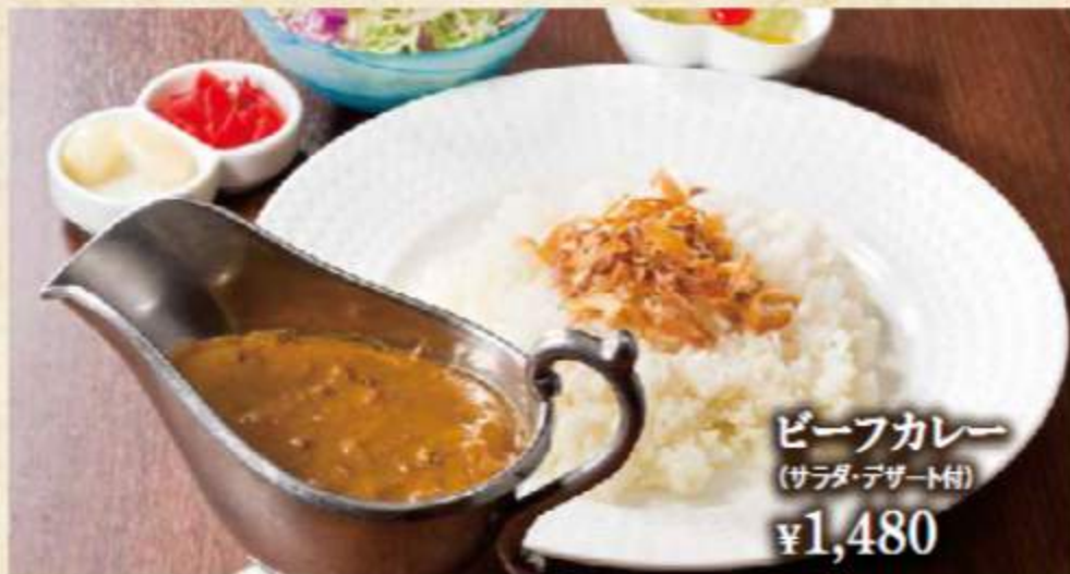
ビーフカレー (サラダ・デザート付) ¥1,480