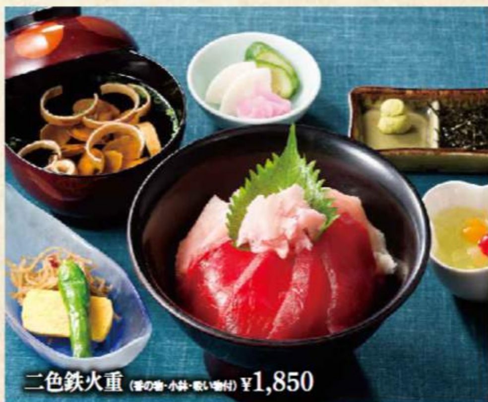
二色鉄火重 (香の物・小鉢・吸い物付) ¥1,850